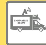
ПОДВИЖНЫЕ ЗВУКОУСИЛИТЕЛЬНЫЕ УСТАНОВКИ