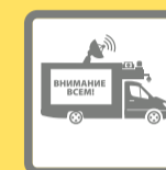
ПОДВИЖНЫЕ ЗВУКОУСИЛИТЕЛЬНЫЕ УСТАНОВКИ