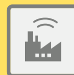
ГУДКИ ПРЕДПРИЯТИЙ И ТРАНСПОРТНЫХ СРЕДСТВ